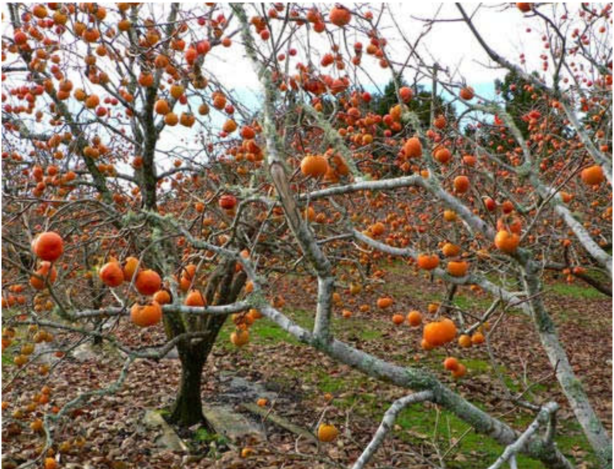
(Cây hồng ăn quả)

7. Ngoài các loại cây trồng nói trên, trong quá trình triển khai thực hiện đề án có thể trồng thay thế bằng các loại cây trồng khác có giá trị kinh tế tương đương phù hợp với nhu cầu phát triển và thị hiếu của thị trường tại từng thời điểm.